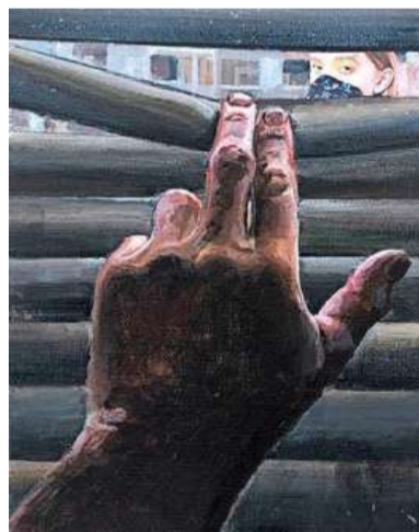
Alle schilderijen meten 18 bij 24 cm.

mand nog kent. Je kunt erin rondlopen, wegdromen en blijven staan bij wat je mooi vindt. Het geeft mij energie en ik krijg er nieuwe ideeën van. Het is een vorm van vrijheid om te kunnen denken en creëren wat ik wil. Dat gevoel van vrijheid hoop ik over te brengen op de kijkers.”