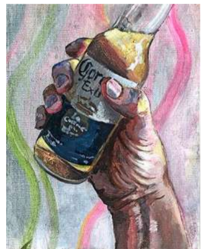
Peepkorn schildert links én rechts.

„ De verzameling schilderijen is mijn levenswerk